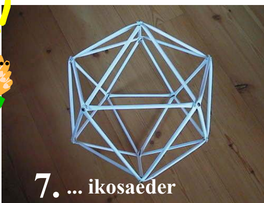
7. ... ikosaeder