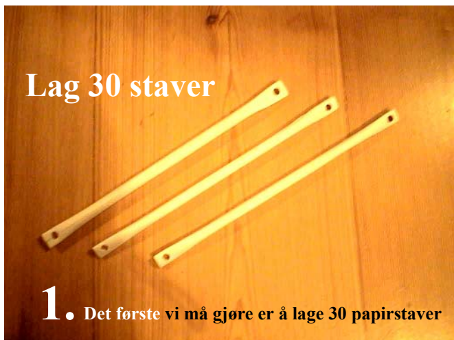
1. Det første vi må gjøre er å lage 30 papirstaver