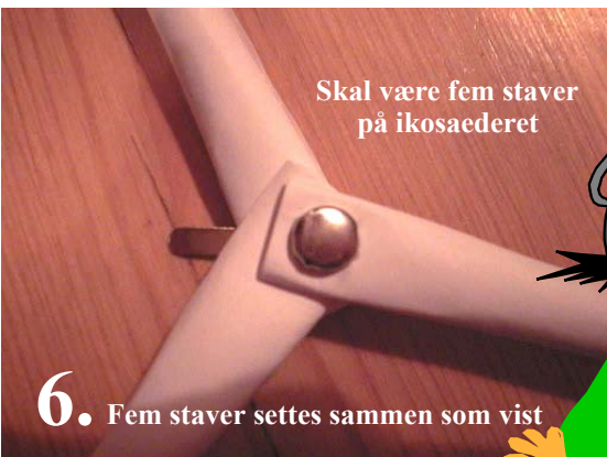
6. Fem staver settes sammen som vist

5. Bøy deretter de fire stavene merket B_1 inntil hverandre og fest dem sammen med en splittbinders. På samme måte bøyes stavene merket B_2 inntil hverandre og festes med en splittbinders.