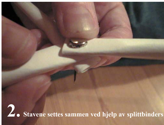
2. Stavene settes sammen ved hjelp av splittbinders