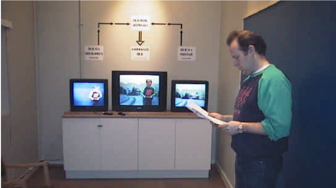
Figur 118.1 “Blue-screen” modellen

Bildet under viser hvordan “Blue-screen”-rommet tar seg ut i utstillingen.