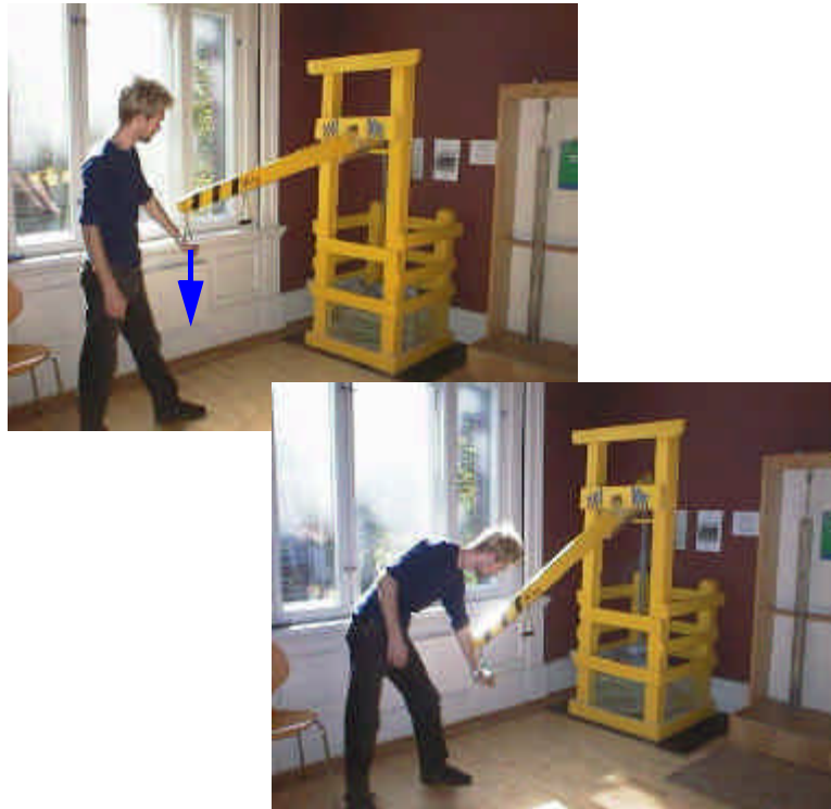
Figur 129.1 Vektstanga slik den står i utstillinga

Bildet under viser hvordan modellen tar seg ut i utstillingen.