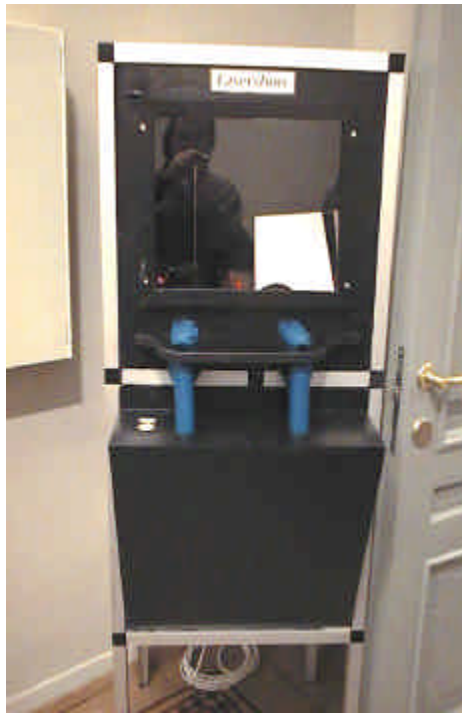
Figur 146.1 Lasershow

Bildet under viser hvordan modellen tar seg ut.