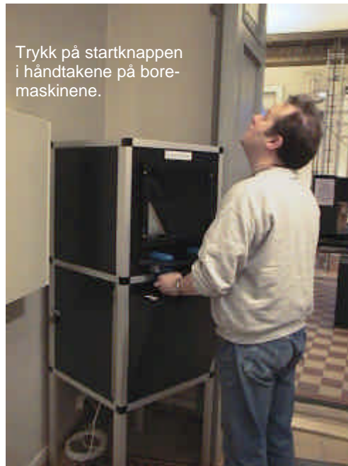
Figur 146.2 Trykk på startknappen og gripp rundt de to boremaskinhåndtakene. Juster hastigheten på boremaskinene og se opp i taket.